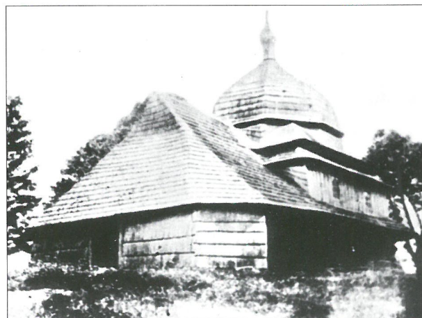
Zdjęcia archiwalne cerkwi