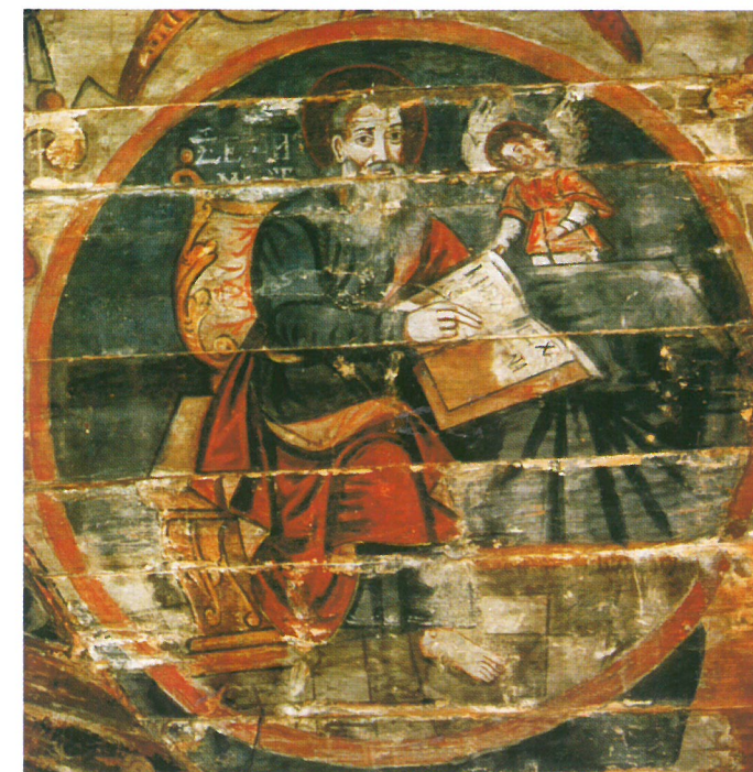
Fragment polichromi w cerkwi

Obecny wystrój wnętrza świątyni tworzą ikony powstałe na Bieszczadzkich Euroregionalnych Warsztatach Malowania Ikon w latach 2001-2002 (Polska, Ukraina, Słowacja, Rumunia).