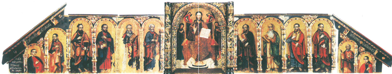
Fragment ikonostasu na wystawie "Ikona Karpacka" w Muzeum Budownictwa Ludowego w Sanoku